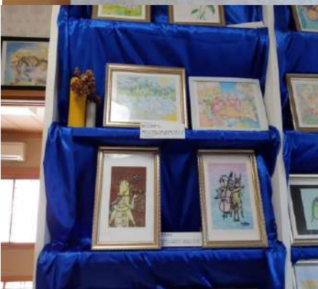
日野 正孝画伯の作品