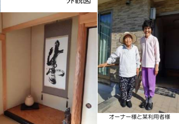
オーナー様と某利用者様