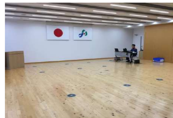
広い会場に・・・。

また、伊予消防署より高齢者の防火対策についてと、家庭内への火災報知機の設置推進についてお話を頂きました。それ以外にも火災につながるような危険な個所を確認して環境改善につながるよう支援が必要だと思ひました。アンケートでは、皆さんのお役に立てたと言って頂き、安堵いたしました。是非とも月に1人でも良いのでシート作成に取り組んでいってください。災害は、明日来るかもしれません。でも来ないかもしれません。だけど、来た時に困らないように…、「あの時頑張っていてよかった」と思えるように…。頑張りましょう！！